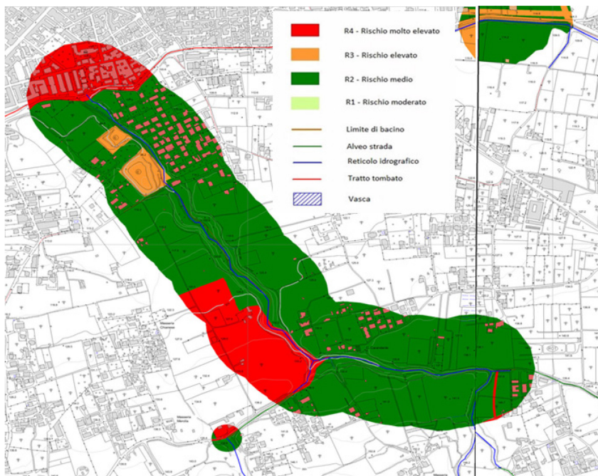
Comuni di Calvizzano (NA) e Marano di Napoli (NA) Alveo Camaldoli – fosso del Carmine – Piano Stralcio di Assetto Idrogeologico dell'ex Autorità di Bacino Regionale Campania Centrale – Stralcio Mappa del rischio idraulico vigente tavv. 447062Ri – 447073Ri.