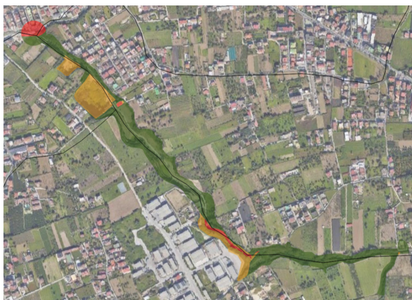
Comuni di Calvizzano (NA) e Marano di Napoli (NA) Alveo Camaldoli – fosso del Carmine – Piano Stralcio di Assetto Idrogeologico dell'ex Autorità di Bacino Regionale Campania Centrale – Stralcio Mappa del rischio idraulico proposta tavv. 447062Ri – 447073Ri.