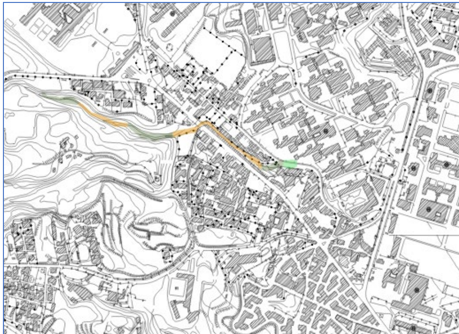
Comune di di Napoli -loc. via Leonardo Bianchi - Piano Stralcio di Assetto idrogeologico dell'ex AdB Campania Centrale –Stralcio mappa del rischio proposta di ripermimetrazione (tav. 447112R)