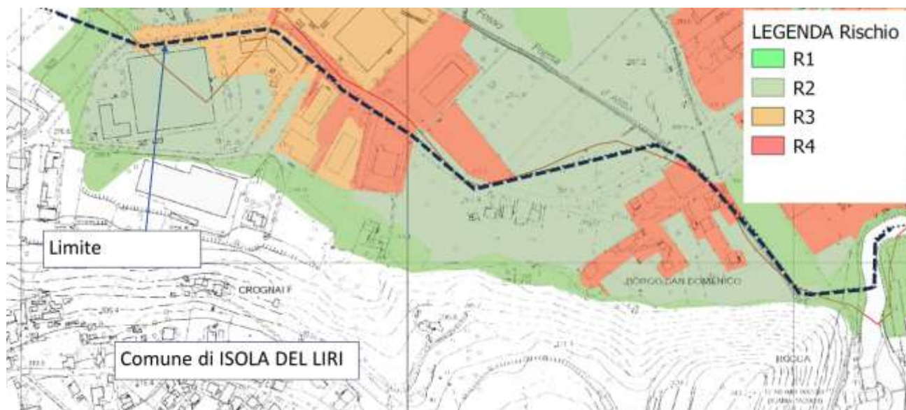
Comune di Isola del Liri (FR) — Piano Stralcio di Assetto idrogeologico - rischio idraulico (PSAI-ri) dell'ex AdB nazionale Liri-Garigliano e Volturno–Stralcio carta del rischio idraulico approvata.