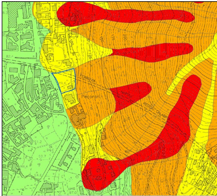
STRALCIO DEL PSAI – CARTA DELLA PERICOLOSITA' DA FRANA CON PROPOSTA DI MODIFICA