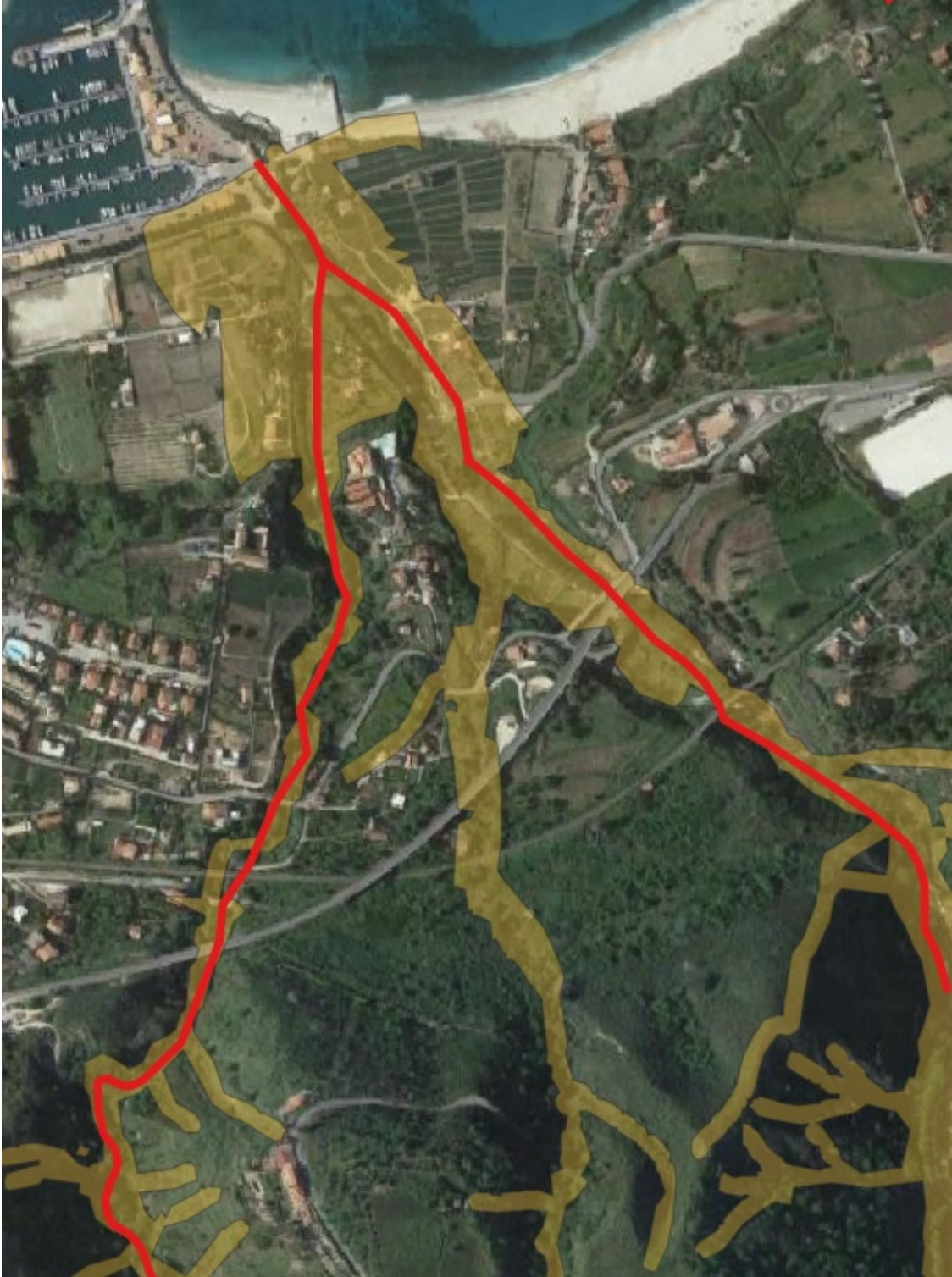
Comune di Tropea (VV)– torrente Burmaria Piano Stralcio di Assetto idrogeologico dell'ex ABR Calabria – Stralcio mappa del rischio idraulico vigente